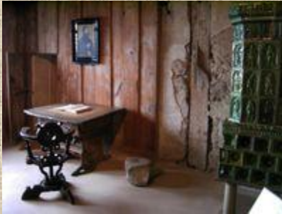
Werkkamer van Luther op de Wartburg

staan op de rijksdag in april 1521 te Worms. Luther weigerde iets te herroepen en verklaarde op 18 april dat hij zich alleen 'door getuigenissen der Schrift of duidelijke argumenten' zou laten overtuigen, want zijn geweten was 'gevangen' in Gods Woord. Hij zei dat het 'onzeker en gevaarlijk is, tegen zijn geweten te handelen. God helpe mij, Amen.' Of de uitdrukking 'Hier sta ik, ik kan niet anders' van Luther is, is niet zeker, maar het geeft wel zijn houding weer.