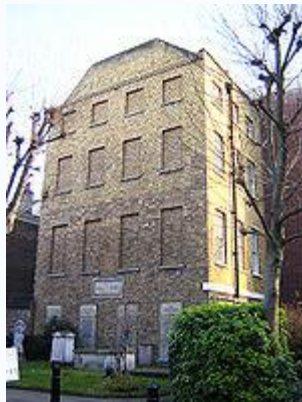
John Wesley's huis aan City Road , Londen. (januari 2006)