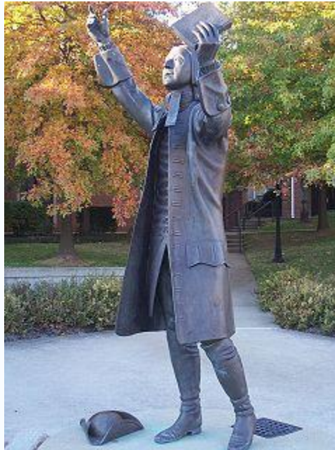
Standbeeld van Wesley bij Asbury Theological Seminary in Wilmore, Kentucky