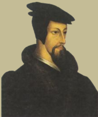
Een jonge Johannes Calvijn