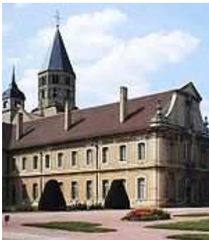
abdij van Cluny

De tiende eeuw - meer bepaald de periode 875 - 950 - wordt een saeculum obscurum (een duistere eeuw) genoemd. In tachtig jaar tijd volgen 24 pausen elkaar op. Paus Johannes XII , die op 17-jarige leeftijd paus wordt, leidt een zeer zedeloos leven.