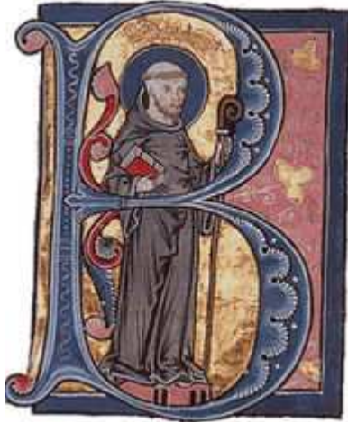
Bernard van Clairvaux

In de tweede helft van de twaalfde eeuw ligt Petrus Valdez (Pierre Waldo) in Lyon (Frankrijk) aan de basis van de stichting van de Waldensische beweging . Deze kan omschreven worden als een eerste protestantse Kerk die de nadruk legt op de autoriteit van de Schrift en de redding door de sacramenten verwerpt.