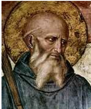
Benedictus van Nursia door Fra Angelico

De zesde eeuw draagt een donker karakter. Het wegvallen van het West-Romeinse Rijk en de volksverhuizingen van de Germaanse stammen hebben ook hun invloed op de geschiedenis van de Kerk. De christelijke leer wordt verder vastgelegd tijdens het Concilie van Constantinopel II (553).