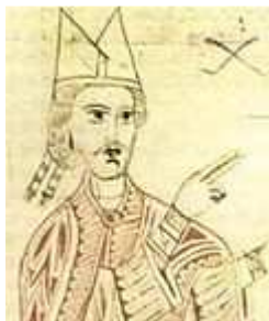
paus Gregorius VII

De elfde eeuw wordt ook beheerst door de investituurstrijd . Hendrik III (1039-1056) is een krachtige hervormer uit het Frankische huis. Het pausdom en de kerk staan circa tien jaren onder zijn invloed. Hij benoemt een aantal pausen. Hij zet ze ook af. In 1059 komt er een kentering. Het conclaaf van kardinalen kiest uit haar midden een paus.