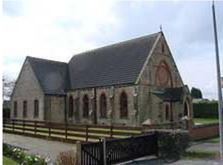
Methodistenkerk te Gilberdyke, Yorkshire

Het methodisme is een stroming in het protestantisme en vindt zijn oorsprong in de 18e eeuw . Het is de resultante van een toenmalige opwekkingsbeweging met piëtistische trekken die zijn start had in het jaar 1738 in de Kerk van Engeland, de Anglicaanse Kerk .