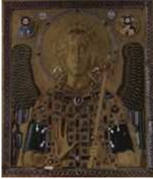
icoon 10e eeuw Aartsengel Michaël

De spanningen tussen het Oosten en het Westen lopen in deze eeuw verder op. De Kerk in het Oosten aanvaardt in 843, op gezag van keizerin Theodora, de afbeeldingen in de kerken. Dit betekende het einde van het iconoclasme . De Kerk in het Oosten verwerpt het vasten op zaterdag en het verplichte priester celibaat .