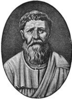
Augustinus van Hippo

De vijfde eeuw wordt beheerst door de definitieve ondergang van het West-Romeinse Rijk . In 410 wordt Rome door Alarik ingenomen en geplunderd. In 476 volgt de definitieve ondergang van het rijk.