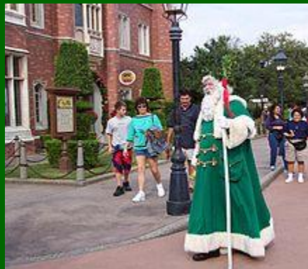
Father Christmas in het Verenigd Koninkrijk

Ook zet men vaak een glazen kaarsenhouder met een waxinelichtje neer om het gezellig te maken in de donkere dagen voor Kerstmis. Op veel plaatsen wordt openbare kerstverlichting gehangen, vooral bij een winkelcentrum, in een winkelstraat of op een plein.