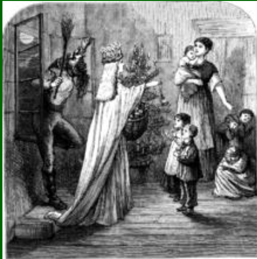
Het Christkind en Hans Trapp

De Kerstman is een afstammeling van Sinterklaas en wordt ook in verband gebracht met kabouters (Nisse of Tomte), zoals Sinterklaas op Sint Nicolaas , bisschop van Myra, teruggaat. Het Sinterklaasgebruik is meegenomen door emigranten naar Amerika. In Amerika werd Sinterklaas Santa Claus . De Kerstman heeft ongeveer dezelfde gebruiken als Sinterklaas, zoals cadeautjes geven, een lange baard en een rood pak, maar hij is inmiddels ontdaan van alle religieuze symboliek.