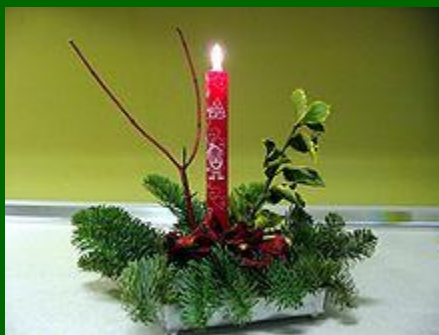
Kaars in een kerststuk

De katholieken gaven eerder aan de kerststal, eventueel met groene versieringen, de ereplaats in huis, pas sinds 1982 staat er in het Vaticaan ook een kerstboom. Protestanten werden echter in het algemeen de beelden van de kerststal, vanwege hun beeldenverbod, vandaar had de kerstboom bij hen meer succes. Overigens bestond er rond de voortdurend groene naaldboom in de warmere, zuidelijke katholieke landen ook geen voorgeschiedenis of heidense folklore zoals in de Germaanse noordelijke landen.