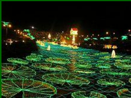
Feestelijke kerstversiering in Medellín, Colombia

In Engeland, de Verenigde Staten en Frankrijk hangt men een maretak op in huis. Deze altijd-groene epifyt is het symbool van vriendschap en vruchtbaarheid. Een meisje dat per ongeluk onder de maretak staat, mag door een jongen worden gekust. En andersom natuurlijk.