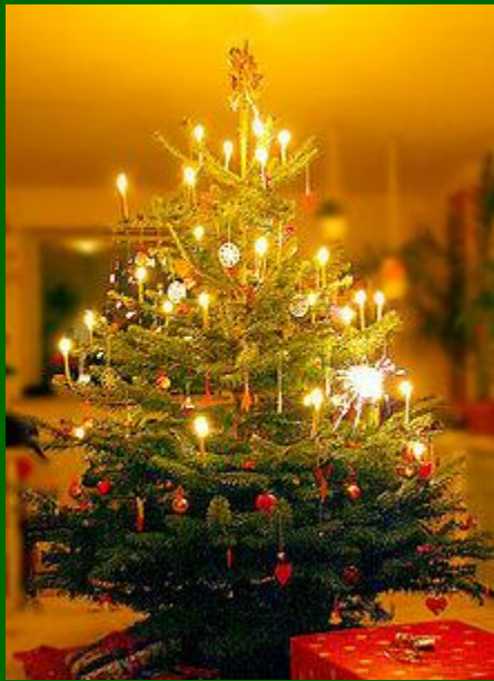
Een Deense kerstboom