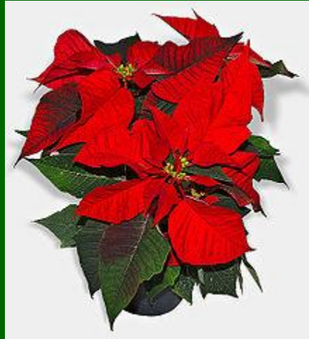
Kerstster ( Euphorbia pulcherrima )

Op kerstavond en eerste kerstdag vindt er in veel kerken een kerstdienst plaats. Het is vaak een van de drukste kerkdiensten van het jaar in vele kerken.